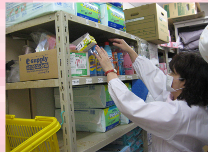
アメニティ委員会